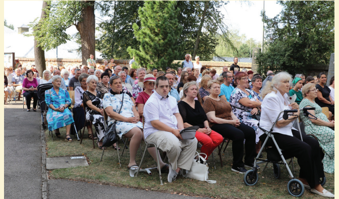
Otvorenie oratória - 1. 9. 2024