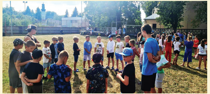
Vyslanie animátorov - 13. 10. 2024