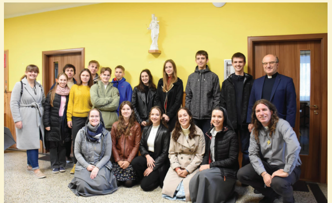
Katák pre rodiny