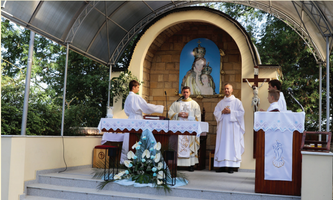
Dubnická púť - 6. - 8. 9. 2024