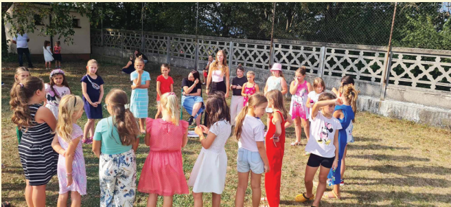
100-ročnica príchodu saleziánov na Slovensko - 6. - 8. 9. 2024