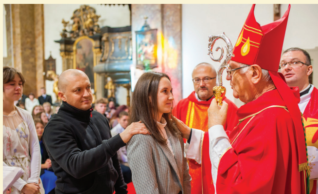
Prvoprijímajúci - dievčatá: nocovačka, chlapci: florbalový turnaj - november 2024