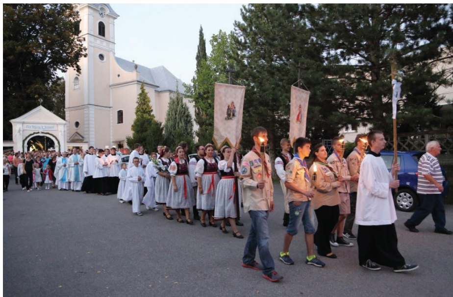
Saleziáni obnovili v Dubnici nad Váhom po 40 rokoch mariánske púte.