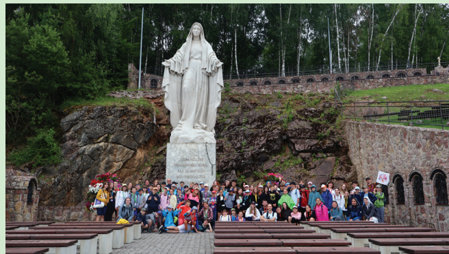
Skautský tábor - 29. 6. - 6. 7. 2024