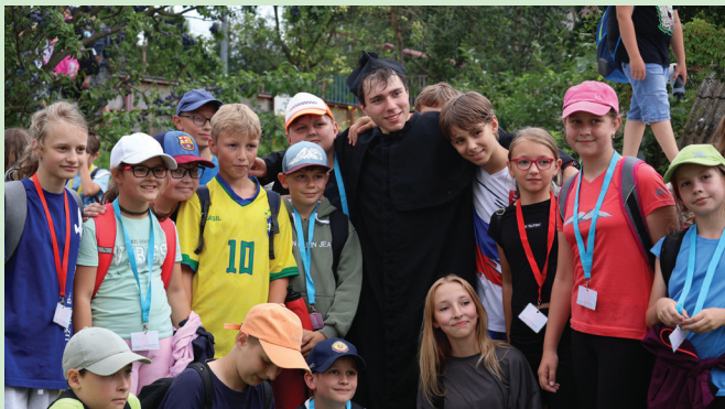
Prímestský tábor - 1. 7. - 5. 7. 2024