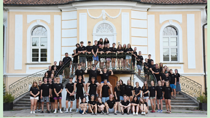
Púť do Turína za donom Boscom 22. 7. - 27. 7. 2024