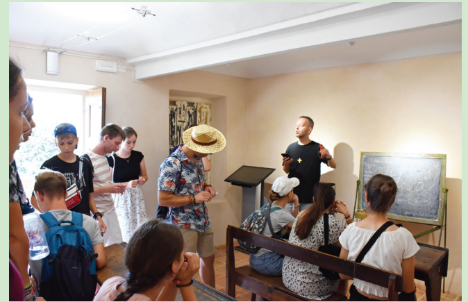
Prímestský tábor cirkevnej školy sv. Dominika Savia 29. 7. - 2. 8. 2024