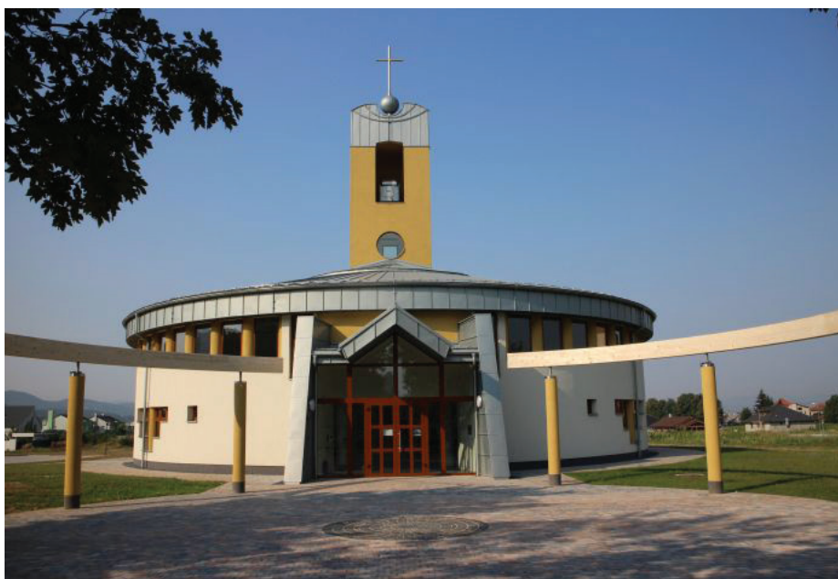
Kostol sv. Jána Bosca v Dubnici nad Váhom bol vysvätený dňa 16. 8. 2015. Bolo to pri príležitosti 200. výročia narodenia sv. Jána Bosca.