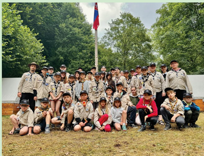
Rodinný tábor - 3. 7. - 7. 7. 2024