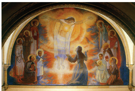
Ježišovo Srdce a sv. Margita Mária Alacoque

■ Počas roka 2024 si aj na Slovensku pripomíname 350. výročie zjavení Najsvätejšieho Srdca Ježišovo svätej Margite Márii Alacoque. Jubilejný rok sa začal 27. decembra 2023. Otvorili ho vo francúzskom Paray le Monial na okružle výročie prvého zo zjavení. Jubilejný rok sa uzavrie slávnosťou Najsvätejšieho Srdca Ježišovo 27. júna 2025.