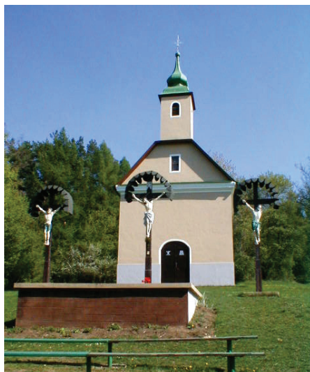
Saleziáni obnovili aj dubnickú kalváriu.