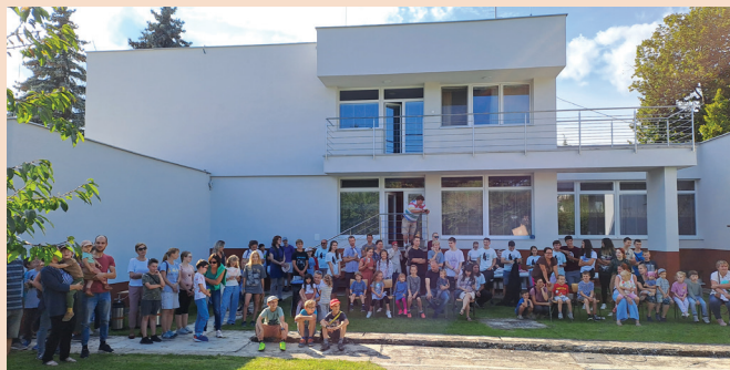
8. - 10.9.2023 Dubnická púť