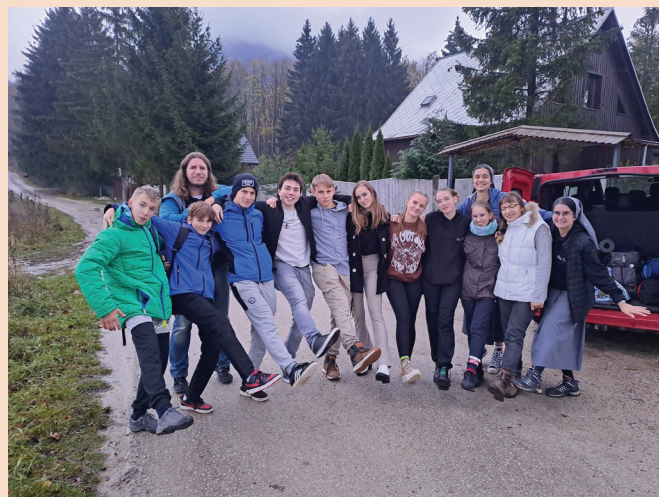
23.11 - 26.11.2023 Duchovné cvičenia farníčov