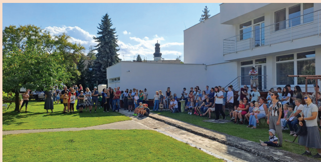
3.9.2023 Otvorenie oratória