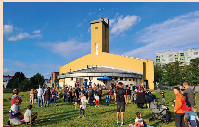
Brigády pri Kostole sv. Jána Bosca