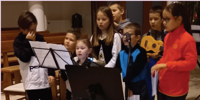
Jasličková pobožnosť - Kostol Jána Bosca